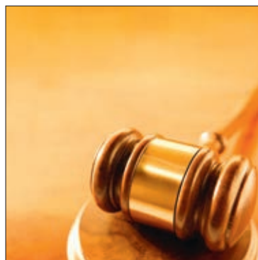
Immer wieder werden Ausweisungen aufgrund fadenscheiniger Begründungen nicht vollzogen.

Wer diese absurde Begründung unserer Gerichte nicht glauben kann, soll bitte selber in der erwähnten Ausgabe nachlesen. Wes-