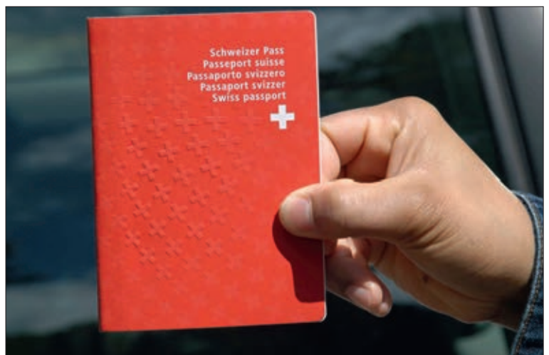
Diese erleichterte Einbürgerung verhindert die ganzheitliche Beurteilung einer individuellen Integration.

Nach der erfolgreichen Ablegung des Sprachtests werden in den betreffenden Gemeinden die Kenntnisse der Antragstellerinnen und Antragsteller in Staatskunde, insbesondere in Geschichte, Politik, Wirtschaft und Kultur der Schweiz, geprüft. Als Grundlage dazu erhalten die Antragsstellerinnen und Antragssteller vorgängig Broschüren, die dieses Wissen beinhalten. Diese Informationen decken die Staatskunde und damit auch die Geschichte der jeweiligen Gemeinde, des Kantons und der Eidgenossenschaft vollumfänglich ab. Die Prüfung über dieses Wissen kann schriftlich oder mündlich erfolgen. Der mündliche Teil kann je nach Gemeinde bis zu 40 Minuten dauern. Danach erfolgt das Gespräch mit der Antragstellerin, dem Antragssteller oder der gesamten Familie durch eine Delegation oder eine Kommission des Gemeinderates (Legislative beziehungsweise Exekutive).