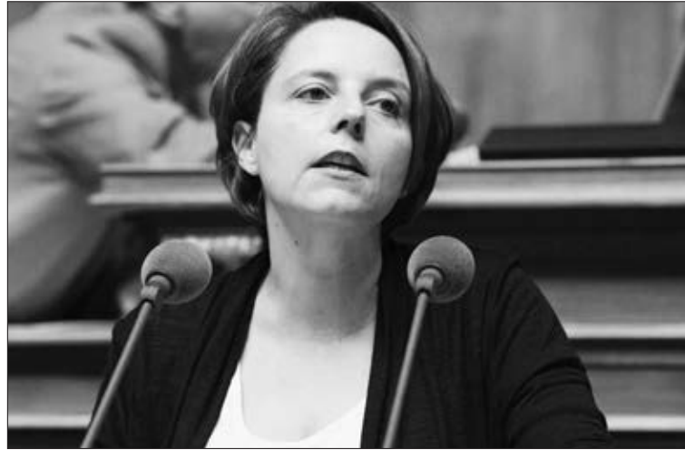
Die SP-Nationalrätin Ada Marra (Bild) war die Urheberin dieser Reform. In Tat und Wahrheit soll es nur ein erster Schritt zu automatischen Einbürgerungen sein.

In solchen Fällen entscheidet die Exekutive ohne die Zustimmung der Legislative beziehungsweise der Gemeindeversammlung autonom. Durch diese erleichterte Einbürgerung wird der erwähnte Prüfungs- und Aufnahmeprozess aufgehoben. Einschneidende Ein-