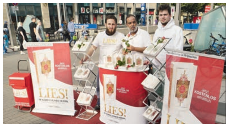
Sowohl in der Schweiz als auch im angrenzenden Ausland werden solche Koranverteilaktionen durchgeführt.