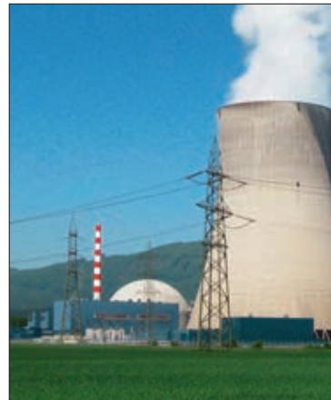
Mit Effizienzmassnahmen und erneuerbaren Energien lassen sich die Kernkraftwerke bis 2029 ersetzen.

Hinzu kommt die kaum lösbare Aufgabe einer Endlagerung der radioaktiven Abfälle. Mehr als die