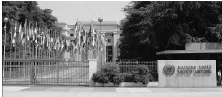
Ohne Nationalstaaten würde kein Völkerrecht existieren. Dieses ist in der UN-Charta (Bild: Büro der Vereinten Nationen in Genf) entsprechend verankert.

Um diese völkerrechtlichen Fehler künftig zu vermeiden gibt es nur eine definitive Lösung: Sterben des Nationalstaates und damit des direkt-demokratischen Rechtsstaates mit den sich bisher daraus ergebenden Freiheiten und eben dem Selbstbestimmungsrecht.